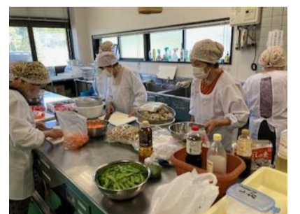
3年~4年前のお弁当づくりの様子&箱膳