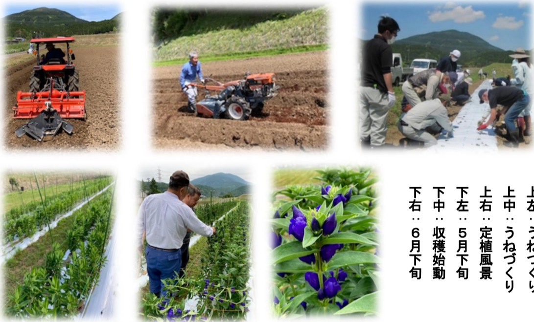
上左：うねづくり 上中：うねづくり 上右：定植風景 下左：5月下旬 下中：収穫始動 下右：6月下旬

県が推奨されている「リンドウ」の栽培に令和4年度から挑戦。令和5年度は、6月下旬から切り花の販売を開始されました。リンドウは、初夏から秋にかけて鮮やかな青紫色の花をつける宿根草。近年ではお盆や秋のお彼岸にお仏壇やお墓にお供えする「仏花」として需要が増えています。アレンジメントなどにも利用されているそうです。※【しがのふるさと支え合いプロジェクト】土山ハイウェイサービス(株)と協働活動しています。